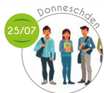
Nomëtteg mat eise Studenten