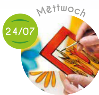
Kreativen Atelier, Laddergolf