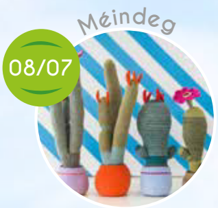
Kaktussen aus Stoff, Karaoke