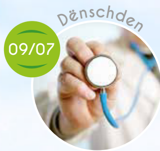
Consultation médicale, Bastelaktivitéit, Fousreflexzomassage,