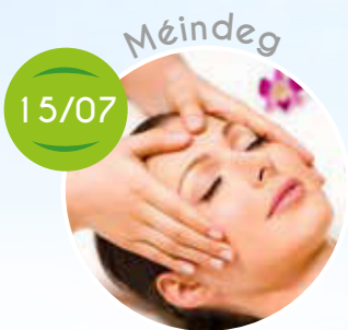
Soins du visage, Spiller