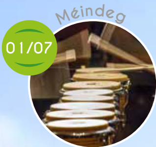
MS Percu Song, Spiller