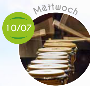
MS Percu Song, Poterstonn