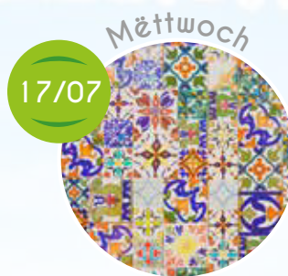
Keramik, Poterstonn mam Sandy