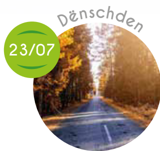
Ausflug mat der Marie-Astrid