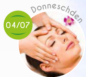
Soins du visage, Kaartespiller