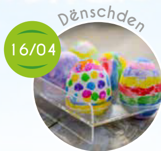
Ouschtereëer fierwe mat de Kanner aus der Maison Relais, Spiller