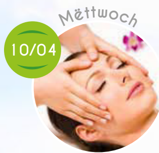
Beauty Day, Soins de Visage, Spiller