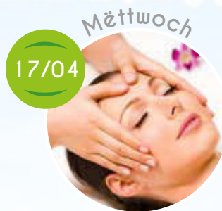
Beauty Day, Keramik, Kicker