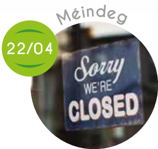
Ouschterméindeg - De Bill ass zou