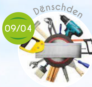
Bastelaktivitéit mam Sophie, Laddergolf