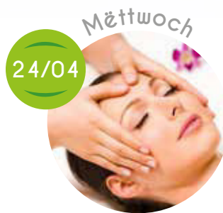
Beauty Day, Percu MS Song, Entspannungsstonn, Spiller