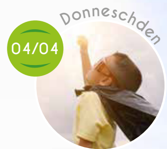
Aktivitéit mat de Kanner aus der Maison Relais, Spiller